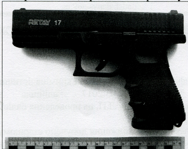
Зображення 1. Пістолет стартовий «RETAY 17».

Наданий на дослідження пістолет (зобр. 1) загальною довжиною 190 мм, найбільшою висотою 131 мм та найбільшою товщиною 32 мм і складається з наступних частин та механізмів: рамки з імітатором ствола; запобіжника; затворної затримки; кожуха-затвору з ударником; ударно-спускового механізм; зворотної пружини з направляючою; прицільних пристосувань; магазину.